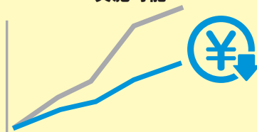
既設 運用コストとの差を可視化