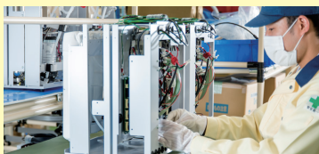
国内工場にて製造